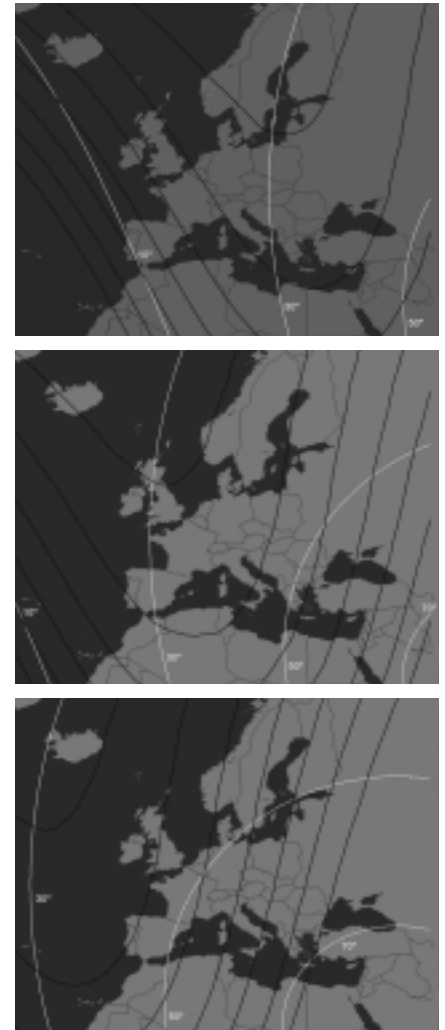
Abbildung 3: Sichtbarkeitsbedingungen der Leoniden 1999 für den aus Modellen vorhergesagten Zeitpunkt 2 h 08 m UT am 18. November [4], für 1.5 Stunden früher und für 1.5 Stunden später. Die hellen Isolinien geben die Radiantenhöhe zu diesen Zeitpunkten an. Die dunklen Isolinien sind eine Funktion, die aus dem Produkt der vom entsprechenden Zeitpunkt verbleibenden Stunden bis zum Beginn der nautischen Dämmerung und dem Sinus der Radiantenhöhe gewonnen wurde.