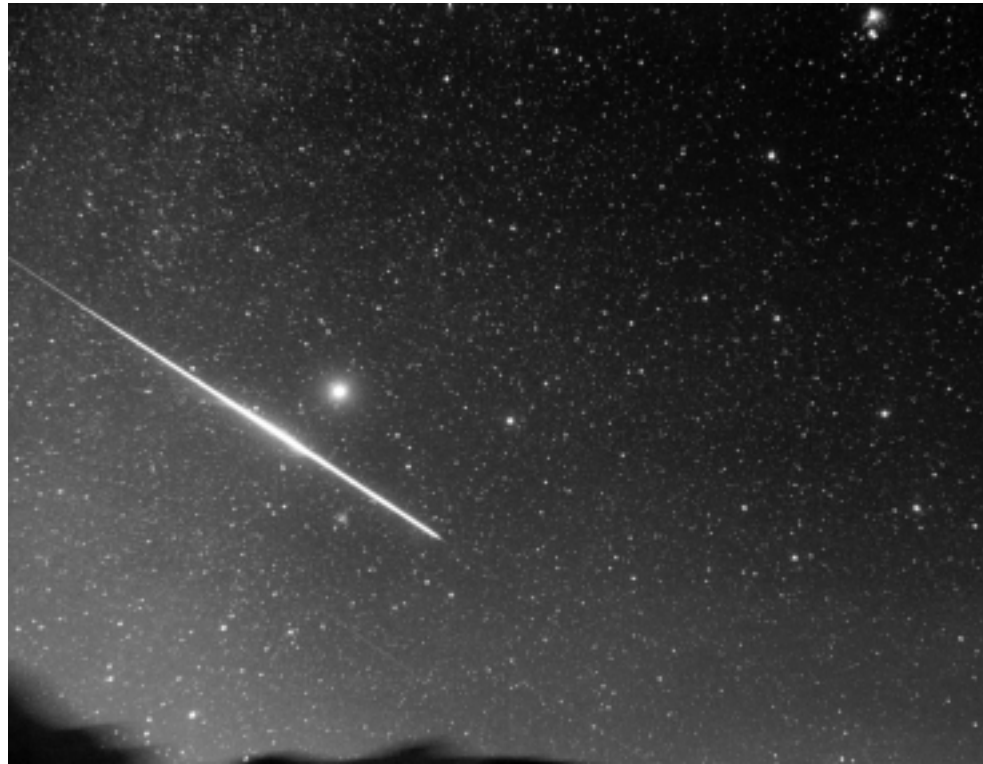
Ein Leonid schlägt Sirius um Größenklassen. Peter Novotny gelang am 17.11.98 um 2:00 Uhr MEZ auf dem Gornergrat dieses eindrucksvolle Fotodokument. Belichtungszeit 10 Min, Film: Pro Gold 400, Objektiv: 50mm/f2

Versucht man, die Leonidenschauer vergangener Epochen im heutigen Maß für die Aktivität eines Meteorstroms auszudrücken [1], so findet man für die amerikanischen Morgenstunden des 13. November 1833 etwa 60000 Leoniden pro Stunde, die sich auf eine visuelle Grenzhelligkeit von +6,5m und Zenitstand des Radianten beziehen (siehe unten). Die folgende Wiederkehr der Leoniden im Jahre 1866 fiel mit etwa 8000 Leoniden pro Stunde auch noch recht beeindruckend aus; das Interesse des außerordentlich aktiven Meteorbeobachters und Amateurastronomen William Denning wurde durch dieses Ereignis geweckt. Es folgten weniger spektakuläre Periheldurchgänge, Raten von 250 im obigen Sinne lassen sich für das Jahr 1901 finden, für die nächste Wiederkehr findet man höchste Raten von etwa 200 im Jahre 1932. Kurz nach