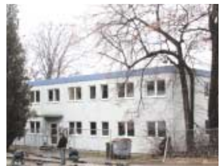
dem Technologiegebäude »Schwarzschildhaus«; der Bibliothek im umgewidmeten Spiegelgebäude und dem Container.