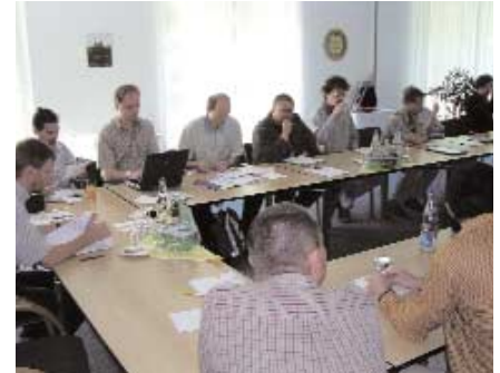
Impressionen vom Strategietreffen in Kühlungsborn

netfeld ("Dynamo-Evolution") in die Sternentwicklung und Entstehung einzubauen. Der dynamischen dreidimensionalen Beschreibung des konvektiven Energietransportes vom Sterninneren bis zur Sternoberfläche wird in diesem Rahmen eine besondere Bedeutung zukommen. Anwendungen dieser Numerik liegen für Vorhauptreihen-Sterne bis hin zu alten planetaren Nebeln vor. Wie in der MHD Abteilung nahm die Codeentwicklung in der Vergangenheit viel Zeit ein, führte aber zu dem nunmehr erfolgreich angewendeten Code CO5BOLD.