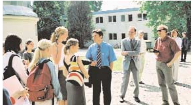
Gäste im AIP: H.O. Henkel, Präsident der Leibniz-Gesellschaft; Minister G. Baaske beim Girls` Day

zu werden Rechnungen mit den schnellsten Supercomputern der Welt durchgeführt, die sich über einige Monate CPU-Zeit erstrecken. Diese Rechnungen sollen Beobachtungen von modernen Rotverschiebungs-Durchmusterungen erklären sowie eigenartige Strukturen in der Materieverteilung wie z.B. galaxienfreie Zonen (sog. "Voids") verständlich machen. Eine Arbeitsgruppe zur Beobachtung von großräumigen kosmischen Strukturen ist noch in Aufbau und eng mit einer Erweiterung des Stellenplanes in 2005-06 gekoppelt.