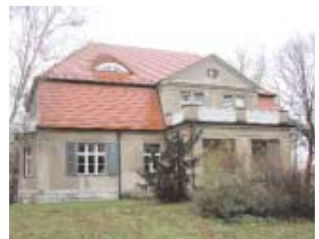
Der Campus in Potsdam Babelsberg mit dem historischen Hauptgebäude; dem historischen Direktorhaus »Villa Turbulenz«;