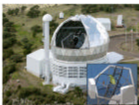
Bild 2: Bild der Konzeptstudie für das amerikanisch-deutsche HETDEX-Projekt (das faseroptisch gekoppelte VIRUS-Instrument am Hobby-Eberly-Teleskop (HET), McDonald Observatorium, USA, dem viertgrößten optischen Teleskop der Welt).