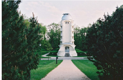
Abb.3: Seit über 75 Jahren dient der Einsteinturm auf dem Telegrafenberg Wissenschaftlern zur Erforschung der Sonnenphysik. Er beherbergt ein Turmteleskop, das eine Brennweite von 14m hat.